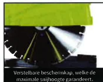
Verstelbare beschermkap, welke de maximale snijhoogte garandeert.