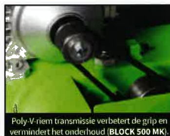
Poly-V-riem transmissie verbetert de grip en vermindert het onderhoud (BLOCK 500 MK).