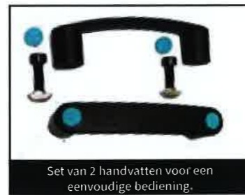
Set van 2 handvatten voor een eenvoudige bediening.