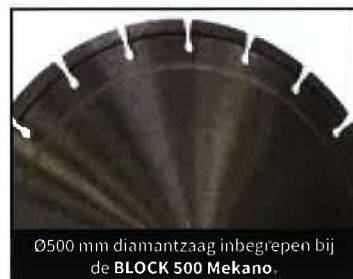
Ø500 mm diamantzaag inbegrepen bij de BLOCK 500 Mekano.