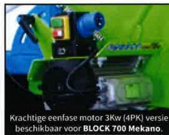
Krachtige eenfase motor 3Kw (4PK) versie beschikbaar voor BLOCK 700 Mekano.