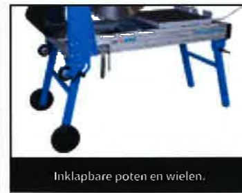
Inklapbare poten en wielen.