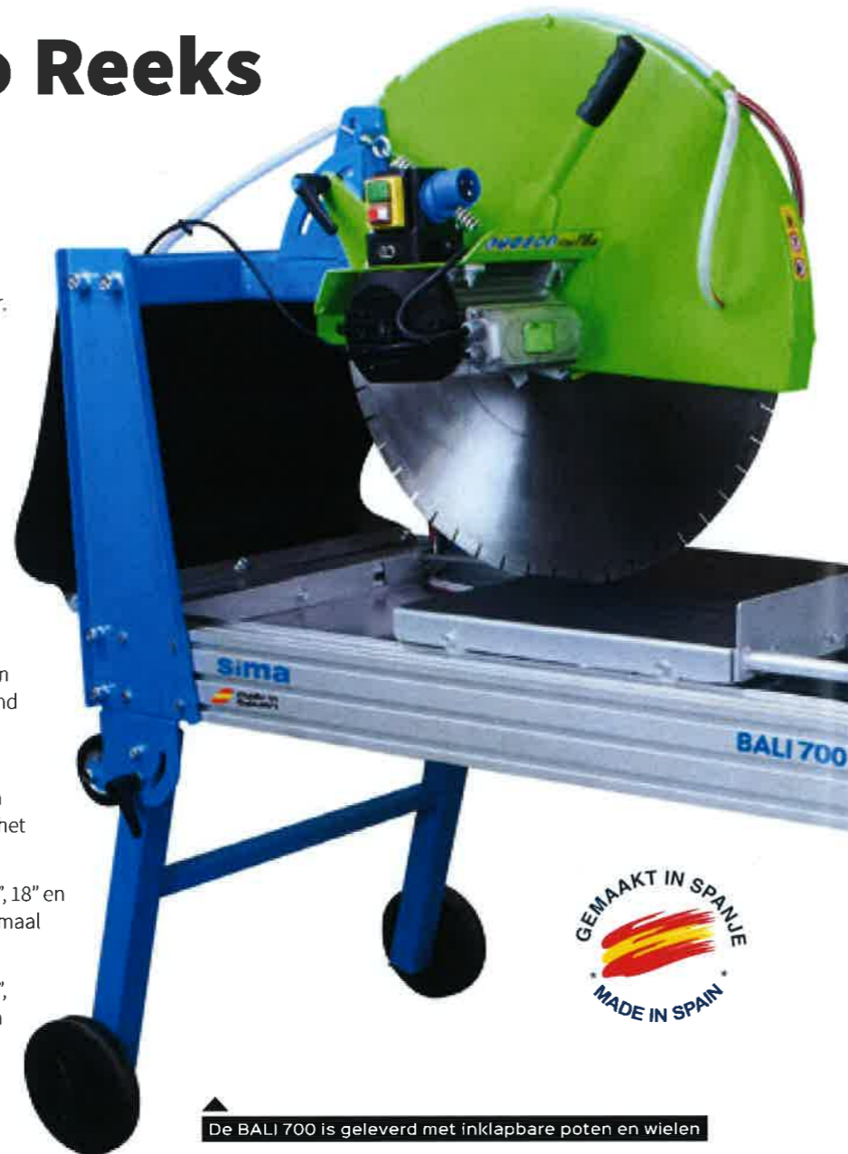
De BALI 700 is geleverd met inklapbare poten en wielen

De BALI 700 serie kan een Ø600, Ø650 en Ø700 mm (24", 25" en 27") zaag gebruiken, dit geeft een zaagdiepte van maximaal 270 mm in één keer.