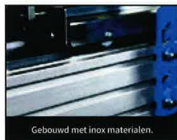
Gebouwd met inox materialen.