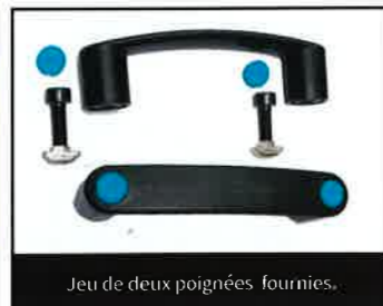
Jeu de deux poignées fournies.