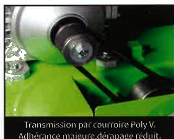
Transmission par courroie Poly V. Adhérence majeure, dérapage réduit.