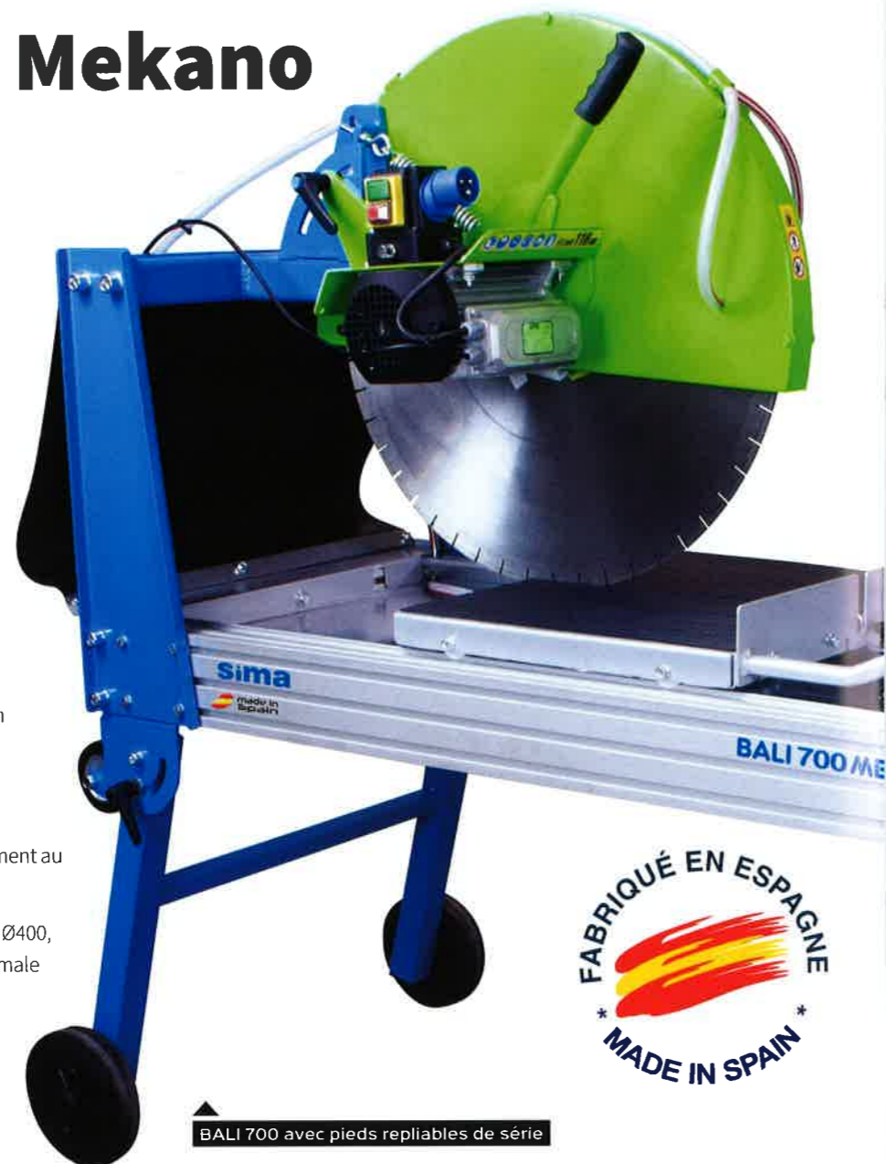
BALI 700 avec pieds repliables de série

La gamme BALI 700 permet l'utilisation de disques diamant de Ø600, Ø650 et Ø700 mm assurant une hauteur de coupe maximale de 270 mm en une seule passe.