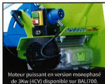
Moteur puissant en version monophasée de 3Kw (4CV) disponible sur BALI700.