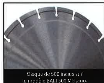
Disque de 500 inclus sur le modèle BALI 500 Mekano.