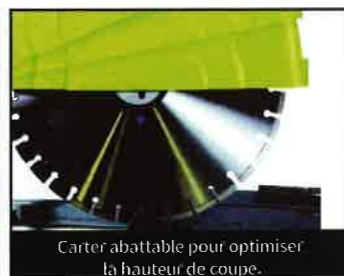
Carter abattable pour optimiser la hauteur de coupe.